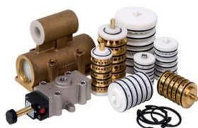
Válvulas de ar